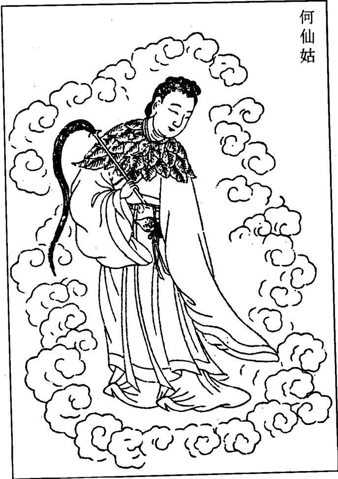
何 仙 姑