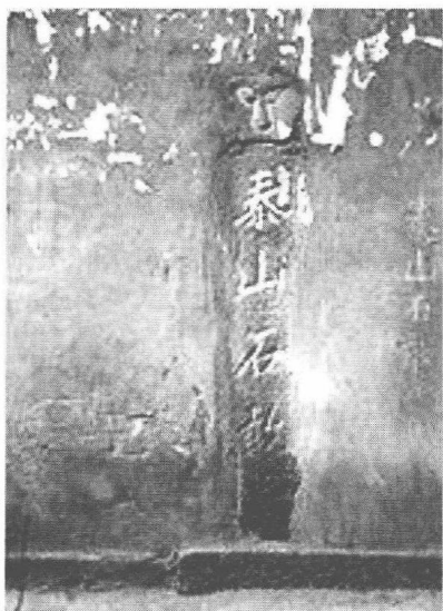
位于北京东四三条的石敢当

关于石敢当的来历，民间有种传说，姜太公封神，封来封去，到最后却忘记了自己的名姓，便自封为泰山石敢当。姜太公在唐宋时期曾被封为武成王，与文宣王孔圣并列，一武一文；明代以后，虽然关羽成为武圣，姜太公在民间仍很有影响，