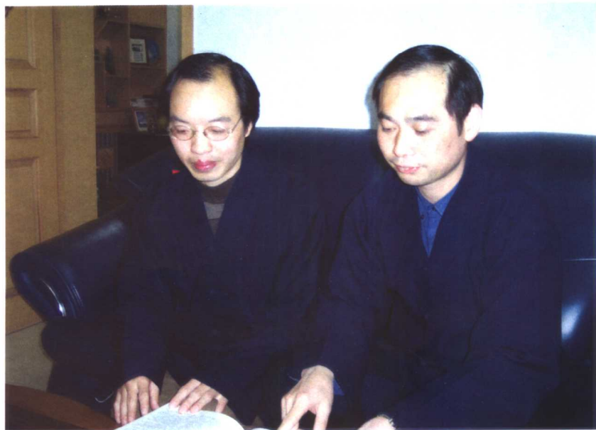
作者（左）与全国人大常委、中国道教协会副会长、中国道教学院副院长张继禹合影