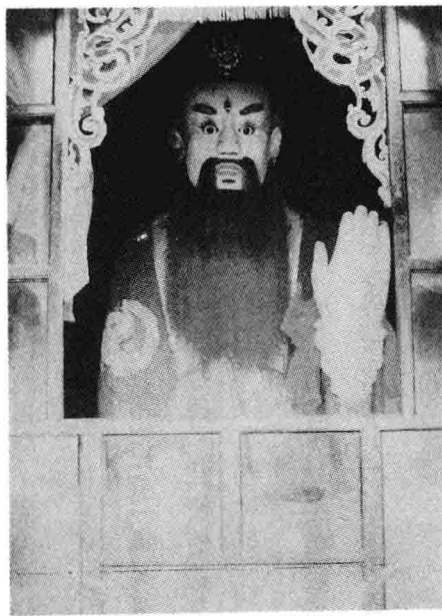
四川青城山天師洞中張陵塑像

原始道教創立時期的另一位重要學者魏伯陽及其修道理論，在當時卻湮沒無聞。此後的七百年間，在社會上也是祕密流傳、悄無聲息。直到五代、