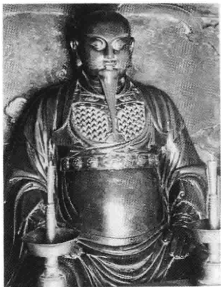
武當山金殿內真武銅像

藝術審美論的形成，有十分突出的作用。由於道教關於宇宙演化的模式在中國古代深入人心，道爲宇宙萬物本源本體的觀念也被當作公理，因此，文學、藝術也就理所當然地成爲道的產物，作者在從事創作時