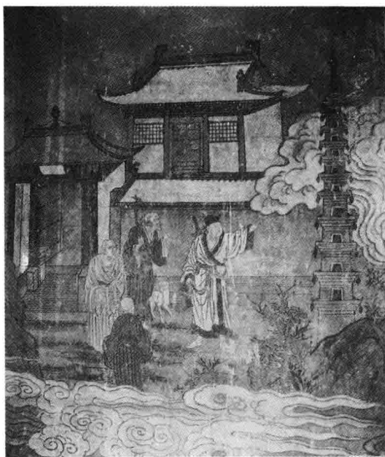
呂洞賓遊寒山寺故事畫