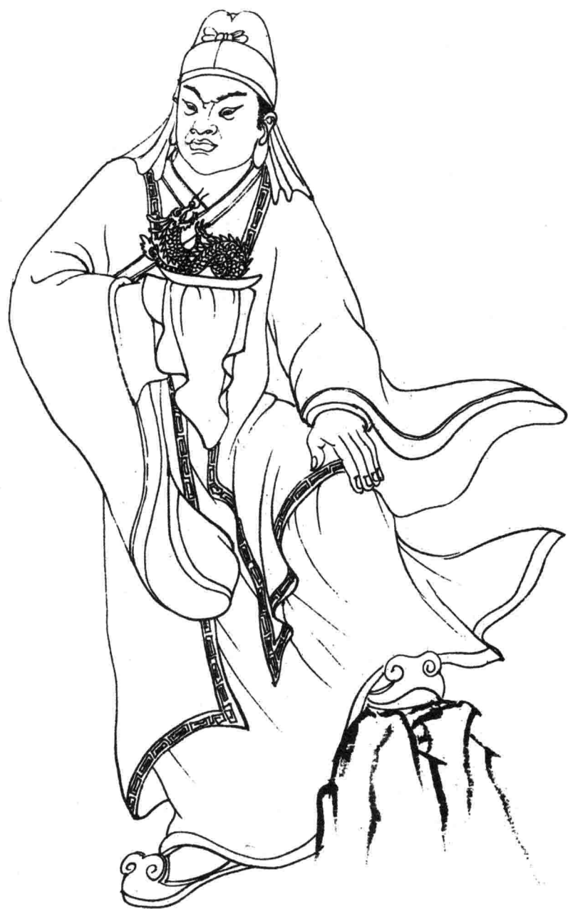
六十甲子神仙圖 ○六五