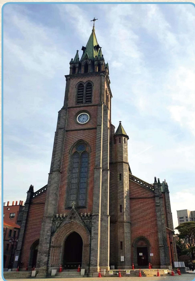
韩国首尔明洞基督教教堂 金知范 供稿