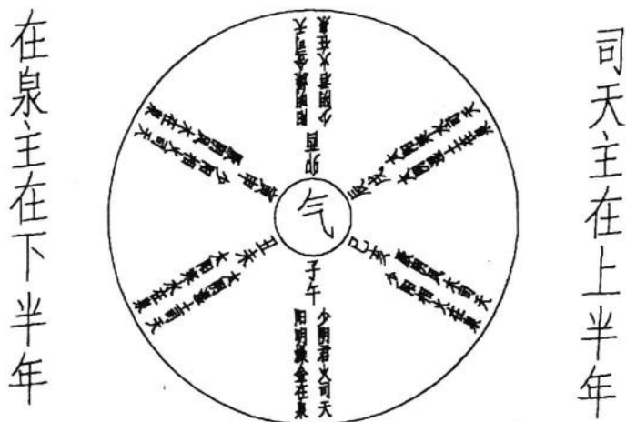
六气 ① 之图

此节主要以图示的形式介绍了五运的寒、温等属性及相关五脏疾病用药方法。如甲、己年时为土主运，根据土喜暖而不喜寒的特点，根据具体的病情，在治疗过程中可适当采用温中补脾的方法，以顺应五运中土的特性。余皆仿此。当然，五运中还有太过不及的情况。太过，指主岁之运气旺而有余，如逢甲年、丙年、戊年、庚年、壬年，皆为阳干主运，阳为太过，故共运气太过；不及，是指主岁之运气衰而不足，如逢乙年、丁年、己年、辛年、癸年，皆为阴干之主运，阴为不及，故其运气不及。如甲己之岁，均为土运之事，但逢六甲年（甲子、甲戌、甲申、甲午、甲辰、甲寅）为土运太过；逢六己年（己巳、己卯、己丑、己亥、己酉、己未）为土运不及。土气太过，则雨湿流行，本气胜也；土气不及，则风乃大行，本气衰而木乃乘之。其余丙辛之岁，戊癸之岁，乙庚之岁，丁壬之岁皆以此类推。