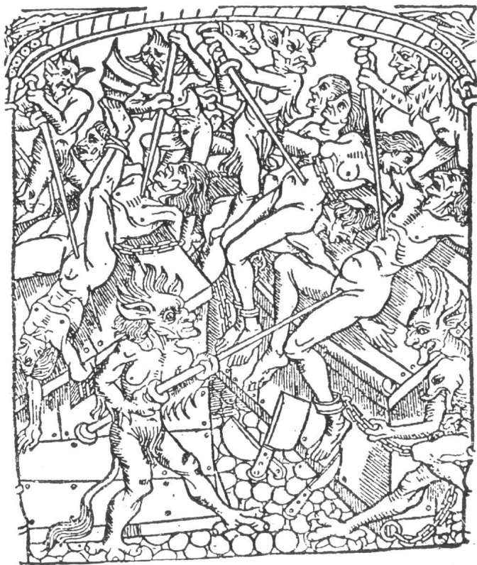
◀ 地狱永罚 (15世纪)